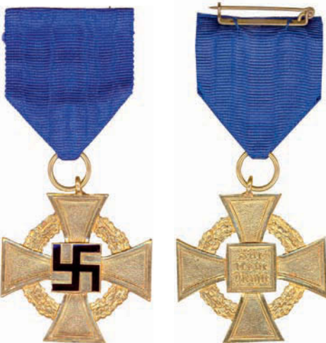
64 wie vor, 1. Stufe für 40 Jahre