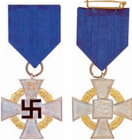
63 Treudienst-Ehrenzeichen, Sonderstufe mit der Zahl „50“, 1938 – 1944